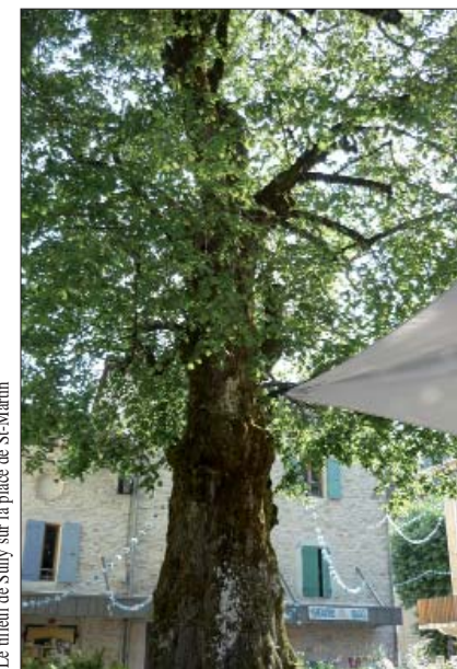
Le tilleul de Sully sur la place de St-Martin

Pas besoin de s’agiter pour profiter à deux de la Fête du Bleu.